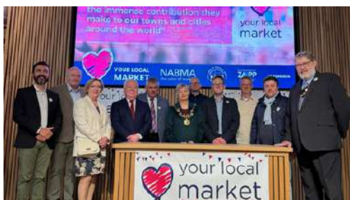
Lançamento internacional 'Maio, Mês dos Mercados' em Chester, 2024

Em 2022, Lisboa foi a cidade anfitriã deste lançamento, reafirmando a importância dos mercados portugueses no panorama global. A cerimónia teve lugar no MARL – Mercado Abastecedor da Região de Lisboa e no Mercado Municipal de Campo de Ourique, dois espaços emblemáticos que representam diferentes dimensões do setor: o abastecimento e a distribuição grossista, por um lado, e a tradição e proximidade dos mercados municipais, por outro. Este evento reuniu representantes do setor, operadores de mercado e autarcas, promovendo um debate sobre a relevância dos mercados para a economia local e a sustentabilidade alimentar.