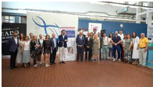
© Lançamento internacional 'Maio, Mês dos Mercados' em Lisboa, 2022, SIMAB

Todos os anos, no mês de maio, a campanha Gosto do Meu Mercado é oficialmente lançada sob o claim 'Maio, o Mês dos Mercados', promovendo um mês inteiro de celebração e dinamização dos mercados alimentares abastecedores e municipais. Como parte desta iniciativa global, um país é escolhido para acolher simbolicamente o evento de abertura, marcando o arranque oficial da campanha a nível internacional.