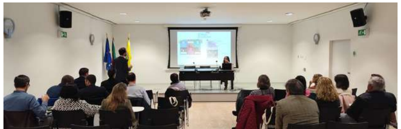
Sessão técnica em Olhão, 2025

Para promover a troca de experiências e o fortalecimento desta rede institucional mas informal de mercados, a SIMAB organiza, indicativamente de dois em dois meses, sessões técnicas online e presenciais com os aderentes da iniciativa. No dia 24 de janeiro, realizou-se uma sessão técnica presencial no Mercado Municipal de Olhão. Estes encontros permitem partilhar boas práticas, discutir desafios e identificar oportunidades para a valorização dos mercados.