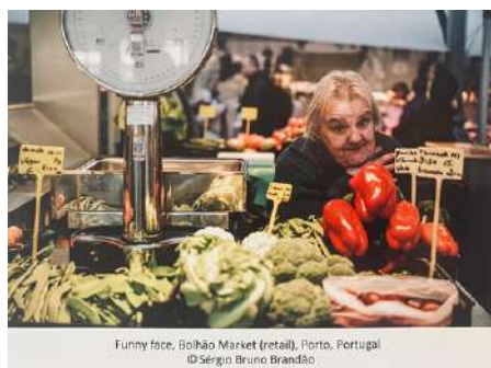
Funny face, Boião Market (retail), Porto, Portugal