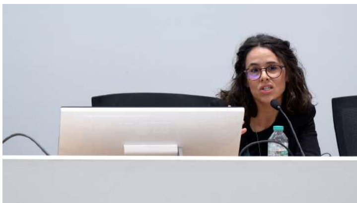
© 2025, SIMAB - Diana Manita