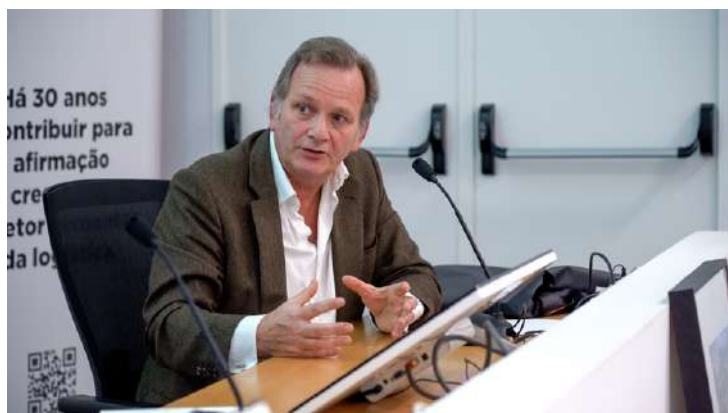
© 2025, SIMAB - Alexandre de Castilho

A formação contínua dos operadores, a aposta na sustentabilidade, na inovação e no posicionamento do Mercado como espaço pioneiro de inovação foram igualmente temas abordados. Para Alexandre de Castilho, o futuro do MARL passa também por reforçar a sua dimensão humana, tornando-o um espaço onde a vertente técnica e operacional convive em equilíbrio com a proximidade, a relação entre pessoas e a identidade do lugar.